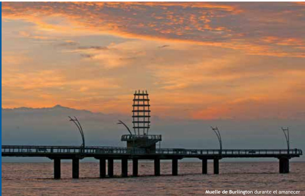
Muelle de Burlington durante el amanecer

El clima de Burlington es, por lo general, continental, con veranos cálidos y húmedos e inviernos fríos y secos. Esto se ve moderado por la proximidad con el lago Ontario, el cual tiende a reducir las temperaturas extremas. Las temperaturas altas mensuales varían de 27 grados centígrados en julio a 0 grados centígrados en enero. El promedio de precipitación anual es 711 mm (28 pulg.) de lluvia y 1.3 metros (51 pulg.) de nieve.