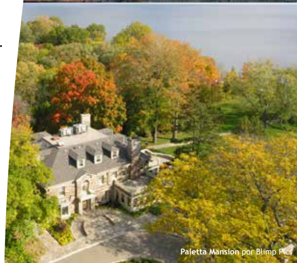
Paletta Mansion