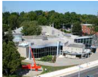
Art Gallery of Burlington: Blimp Pics