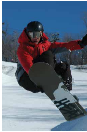
Snowboard en Glen Eden