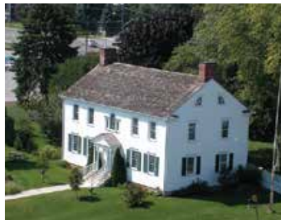
Joseph Brant Museum: Blimp Pics

El período agrícola de nuestra historia estuvo marcado por actividades que han desaparecido. Las fábricas de conservas comerciales, la recolección de hielo y la cestería fueron reemplazadas por empresas modernas e industrias de alta tecnología que propiciaron el crecimiento demográfico. Desde la visita de LaSalle a esta zona hace más de 300 años, Burlington se ha convertido en una exitosa urbanización, con una atractiva calidad de vida.