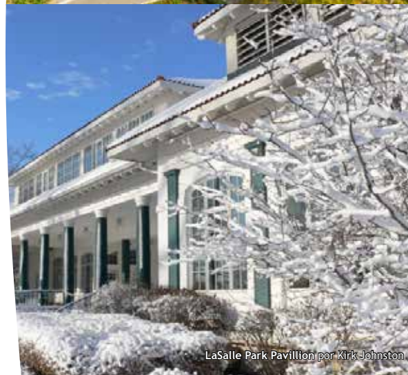
LaSalle Park Pavillion por Kirk Johnston