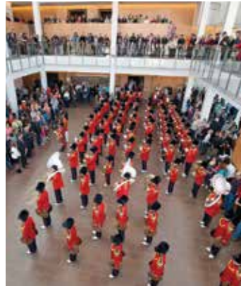
Burlington Teen Tour Band en The Burlington Performing Arts Centre