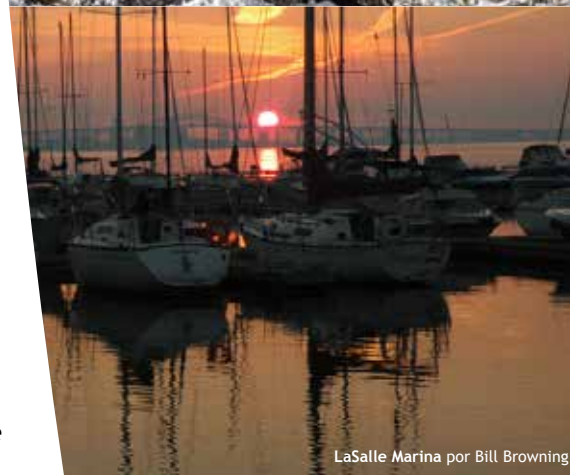
LaSalle Marina por Bill Browning