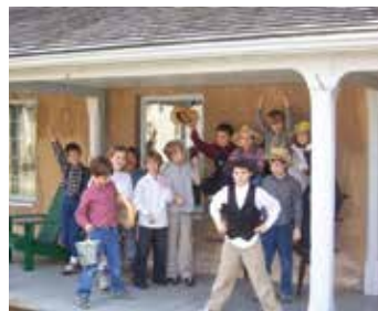
Casa irlandesa en la granja Oakridge