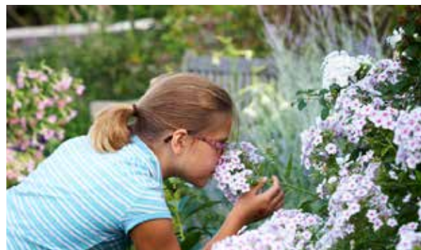
Royal Botanical Gardens por Daniel Banko

Con tanta diversión, y atractivos pintorescos y asequibles, Burlington ofrece satisfacción garantizada tanto para las familias como para cada individuo.