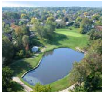
Campo de golf municipal de Tyandaga