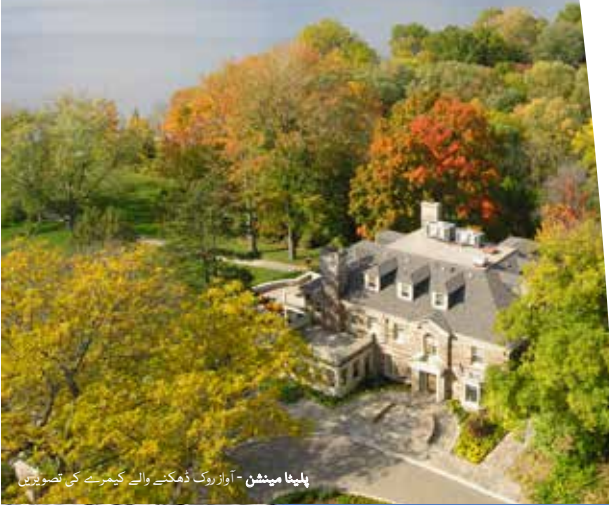
پلینا مینشن - آواز روک ڈھکنے والے کیمرے کی تصویریں