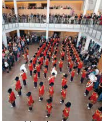
برلنگٹن پرفارمنگ آرٹس سنٹر میں برلنگٹن ٹین ٹور بینڈ