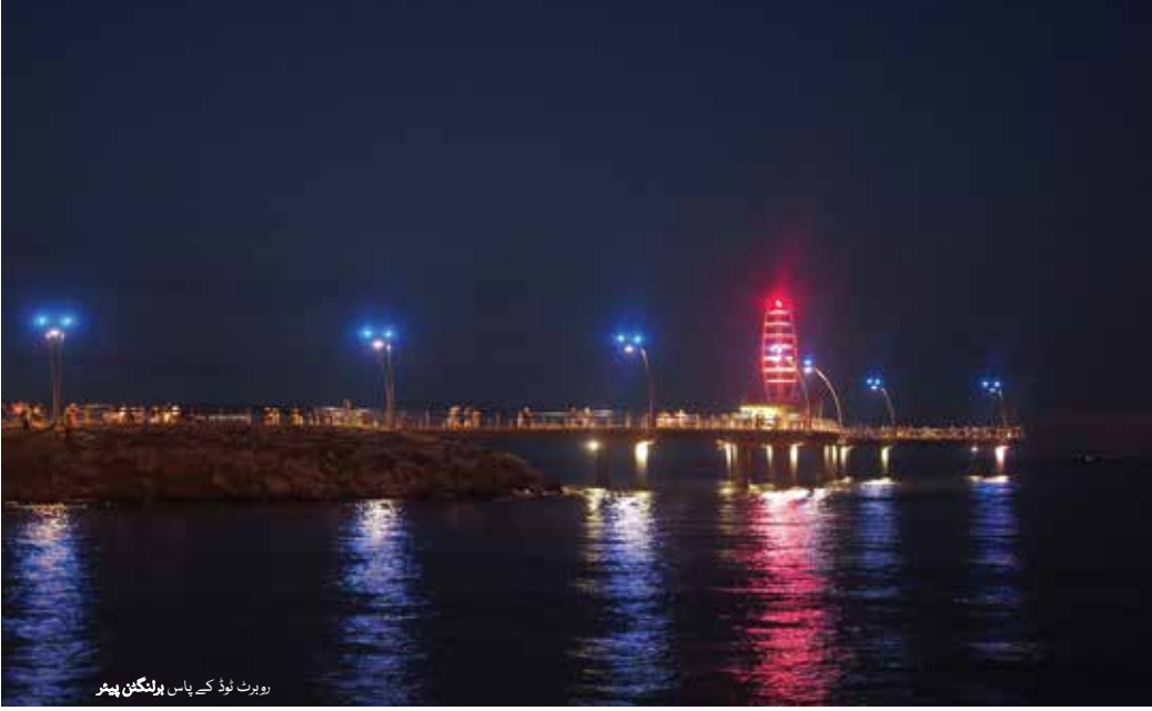
روبرٹ لوڈ کے پاس برلنگٹن پینٹر