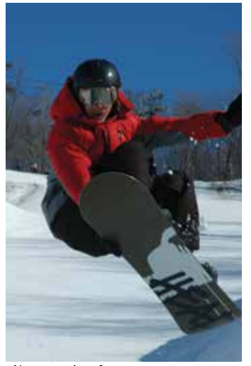
گلین ایڈن میں اسٹیوڈنگ