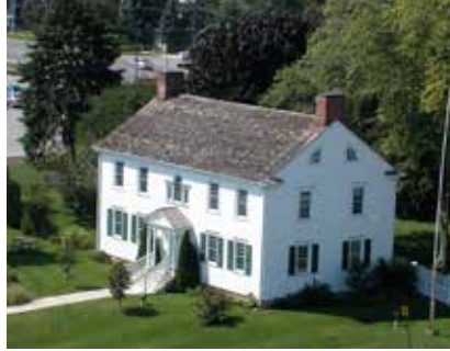
جوزف برانٹ میوزیم - آواز روک ڈھکنے والے کیمبرے کی تصویریں