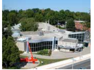
برلنگٹن آرٹ سنٹر - آواز روک ڈھکنے والے کیمرے کی تصویریں