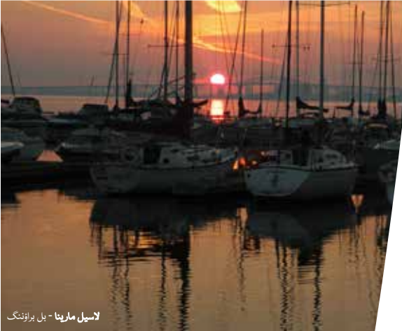
لاسیل مارینا - بل براؤننگ