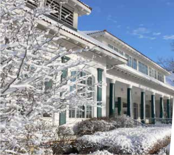
لاسیل پارک پوبلین - کاک جوشین