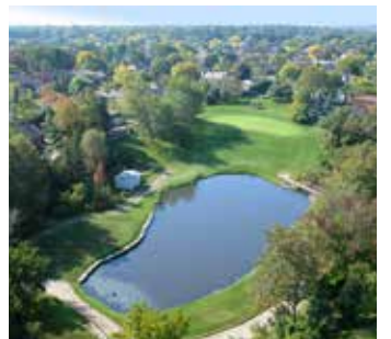
ٹیلڈا میونسپل گرین کریس - آواز روک ڈھکنے والے کیمرے کی تصویریں