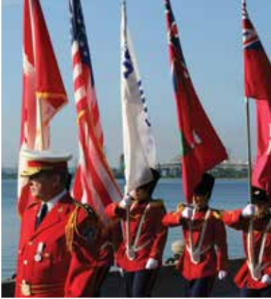
برلنگٹن لین ٹوریزم

1784 میں یو ایس کی آزادی کی لڑائی میں برطانیہ کی طرف سے لڑنے کے اعتراف میں کیپٹن جوزف برانٹ کو ایک بڑا قطعہ آراضی عطا کیا گیا تھا۔ برانٹ کے ذریعہ اپنے بلاک میں آراضی کی فروخت کاری نے اس علاقہ کے آغاز کی نشاندہی کی جو برلنگٹن کی شکل میں سامنے آیا۔ برانٹ کے گھر کے قریب دو ڈھانچے، جوزف برانٹ میوزیم اور جوزف برانٹ ہاسپٹل، ان کے نام سے دو یادگار عمارتیں ہیں۔