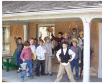
اوکریج فارم پر آئرلینڈ ہاؤس