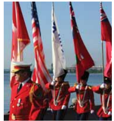
De Burlington Teen Tour Band