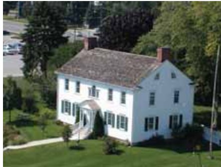
Joseph Brant Museum - Blimp Pics

De agrarische periode van onze geschiedenis had activiteiten die nu niet meer bestaan. Commerciële conservenfabrieken, het oogsten van ijs en mandfabrieken zijn vervangen door moderne concerns en high-tech bedrijven, waardoor een grote toevloed van nieuwe bewoners ontstond. Vanaf het bezoek van LaSalle naar deze streek meer dan 300 jaar geleden, is Burlington gegroeid tot een enorm succesvol stadsgebied met een aantrekkelijke levenskwaliteit.