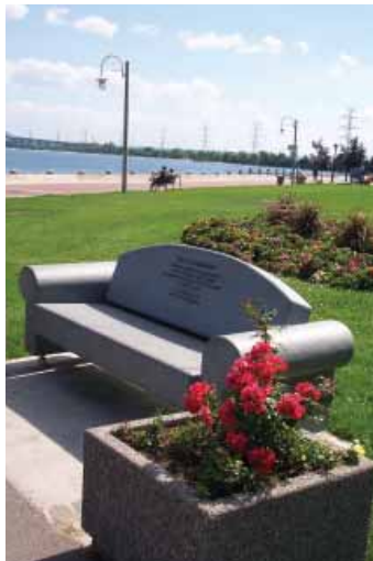
"Louise" Landschap meubilair geschonken door Apeldoorn, Spencer Smith Park